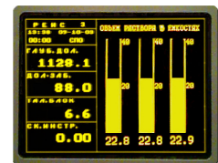
Экраны рабочего места бурильщика